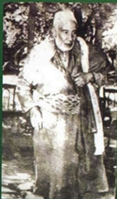
العارف بالله تعالى السيد محمد الحارون المجدد القائل