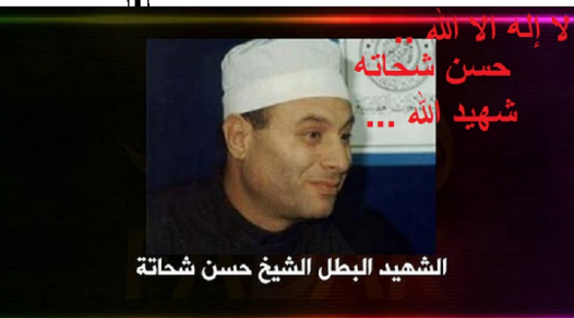
الشميد البطل الشيخ حسن شحاتة