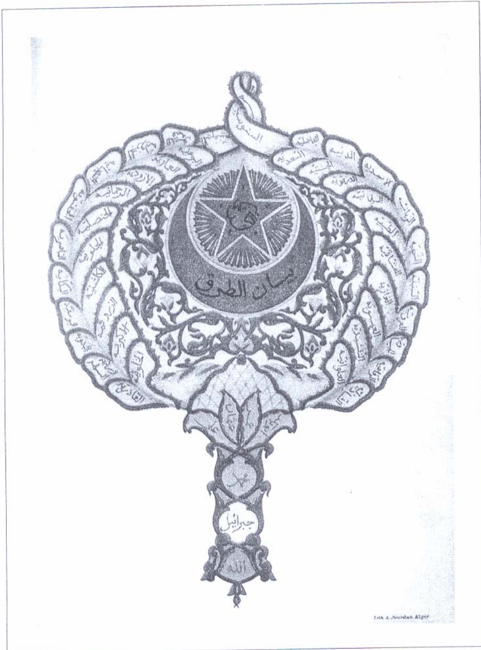
بيان الطرق الصوفية