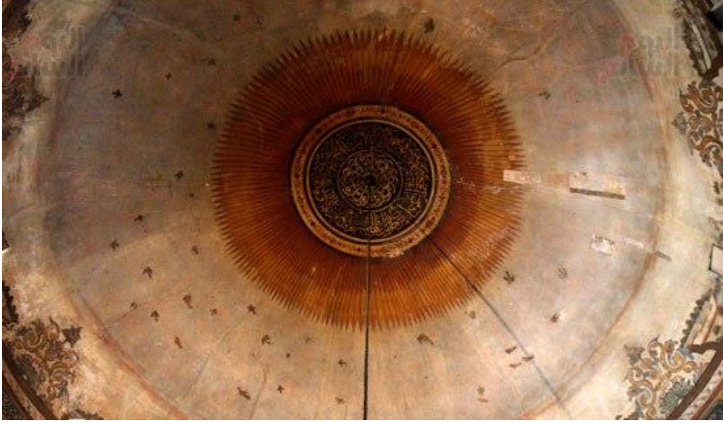
( صورة 7 ) : زخارف قبة التكية من الداخل

وتزدان القبة من الداخل بأيات قرآنية في مركزها تحيط بها زخرفة على هيئة قرص الشمس وعلى محيط القبة زخارف الطيور. (صورة 7). ويُعد طقس السماع أو رقص المولوية من أشهر فنون الطريقة المولوية وهو طقس له