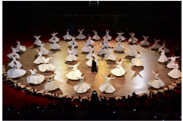
( صورة 8 ) : انعكاس المنظور الفلسفي للفكر الصوفي على العمارة الإسلامية : أ - المركزية في رقص المولوية