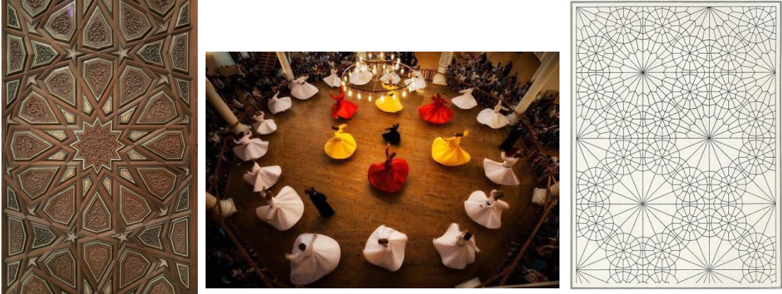
(صورة 3) : الزخارف الهندسية تؤلف تكوينات دائرية إشعاعية تدور حول نفسها وحول مركزها في صورة تعكس الكون بما يدور فيه متأثرة بالفكر الصوفي في البحث عن الجوهر الخالد وهو ما يسعى إليه المولوية من خلال الأداء الحركي في رقصهم

وبالرغم أن الزخارف الهندسية هي ثمرة تفكير رياضي إلا أن الفكر الصوفي بها جليا من خلال المعاني الروحية التي تعكسها ، فخطوطها التي تنطلق مندفعة من مركز لتؤلف تكوينات تتكاثر وتتزايد متفرقة مرة ومجموعة مرة وكأنها مجموعة من الصوفية يؤدون رقصة المولوية حين يرقصون بأشكال دائرية على أصوات الموسيقى الصوفية فيتجه الصوفيون بهذه الحركات إلى التحرر من الدنيا ومشاكلها والتقرب إلى الله بذهن صافٍ فتنساب روحه داخل عالم آخر يخلو من الهموم والحياة المادية ويرتفع بمشاعره ووجدانه إلى درجة الصفاء الذهني فيخرج من مشاعره الدنيوية وحياته الفانية إلى الوجود الإلهي ، كما يتجلى التأثير الصوفي على الفن الإسلامي من خلال سعى الفنان المسلم إلى الكشف عن الجوهر الكوني المتصل والمتربط والذي لا يقبل التجزئة ولا التباين ، وهذا السعى يتجسد في الزخارف فنجد في الأطباق النجمية الصورة الإشعاعية ونرى الكون بما فيه يدور في فلك واحد منشأة ومنتهاه الله (صورة 3) .