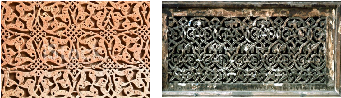
( صورة 4 ) : تتجلى جماليات الفكر الصوفي من خلال الإيقاعات المتكررة اللانهائية للزخارف النباتية والتي تعكس الحقيقة الماورائية وتعلو خارج حدود المكان والزمان

كذلك الحال في الزخارف النباتية والتي تنتشر برشاقة وليونة في إيقاعات متكررة فتمنح المتأمل إحساسا بالمطلق عبر استغراقات إيقاعية لا نهائية متأثرة بالحس الغنائى الصوفي ، كما يتجلى الفكر الصوفي في نتاجات الفنان المسلم من خلال تكراره للوحدات الزخرفية ، فالتكرار نابع من ذهنية الفنان المسلم والذي سعد فيه الفكر الصوفي ودعاه إلى إنكار الذات ودفعه إلى الاتصال بالمطلق ، فالتكرار هو مظهر من مظاهر الوجود الصوفي ( صورة 4 ) .