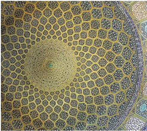
ب - المركزية في زخارف القبة في العمارة الدينية

رمزيته ، فالدورات الثلاثة حول باحة الرقص ترمز الى المراحل الثلاث في التقرب إلى الله ، وهي طريق العلم والطريق إلى الرؤية والطريق المؤدى إلى الوصال ، ودائرة الراقصين تقسم على نصفي دائرة ،يمثل أحدهما قوس النزول أو انغماس الروح في المادة ، ويمثل الآخر قوس الصعود ، أي صعود الروح إلى بارئها ، ويمثل دوران الشيخ حول مركز الدائرة الشمس وشعاعها ، أما دوران الدراويش حول الباحة فتمثل القانون الكوني ودوران الكواكب حول الشمس وحول مركزها(4) ، وتنعكس جماليات الفكر الصوفي تلك بشكل جلي في زخارف القبة في العمارة الدينية ، فالقبة مركز إشعاعي حيث يكون مركزها هو مصدر الأشعة الخارجية منها سواء خطأً أو رسماً فتتركز عناصر الشكل في مركزها من الداخل للخارج ، وهذا النظام الدائري يمنحنا رؤية كلية أوسع للصورة وهو من منظور الصوفية يعكس إحاطة الله بكل شيء ، كما أن الخط الدائري الذي ينطلق من مركز القبة طبقاً لنظام حلقي يمنحنا إحساساً بالديمومة إذ أن نقطة الانطلاق في كل حلقة دائرية تبدأ من نقطة ما لتنتهي إلى ذات النقطة لتنتقل من جديد من ذات النقطة إلى ما لا نهاية عبر سلسلة توحى بالحركة حتى تنتهي حيث مركز القبة فتبارك الله الذي يبدأ الخلق ثم يعيده ثم إليه يرجع الخلق ذاته ( صورة 8 ) ، ونتيجة لهذا التداخل الحلقي