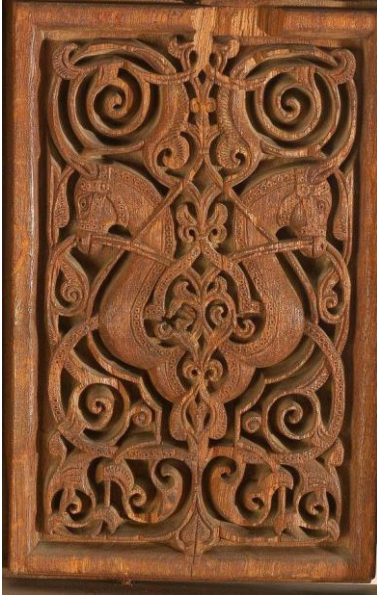
(صورة 1) : جمالية التجريد في الفن الإسلامي تسمو بالأشكال فوق ماديتها .. حشوة باب من العصر الفاطمي.

من خلال دراسة مفاهيم التصوف وثقافة الفكر الصوفي نجد آثارا واضحة لانعكاس المفاهيم الصوفية على الفن الإسلامي من خلال تجلّي قدرته على إضفاء طابع مميز مرتبط بتوجيهه فكري ووجداني ، فالفنان المسلم بتأثره بالصوفية يسعى إلى المعاني الكاملة وراء الأشياء حيث المعنى الإلهي . فالفن الإسلامي لا يستكف من