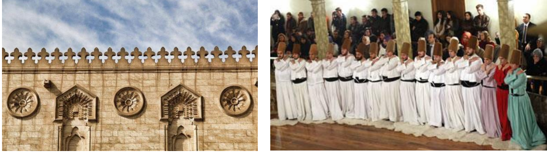
(صورة 9) : شرفات المساجد زخرفة صوفية الفكر تعكس مفاهيم التلاحم والحب والاخوة

للاشكال الدائرية المترابطة يُؤد لدى المتأمل إحساساً بتعاقبية حركية تفضى إلى شعور بالديمومة المطلقة(7) والتي تعكس في رمزياتها القانون الكوني كما هو الحال في رمزية الحركة الدائرية للرقص المولوى . وتعد الشرفات أو العرائس أعلى عمارة المسجد أحد آثار الفكر الصوفى على العمارة الدينية ، حيث تعكس تلك الوحدات الزخرفية فى تراسها وتجاورها وتلاحمها أشكال المصلين الواقفين فى صفوف مترابطة متلاحمين دون أن يفرق بينهم جنس أو لون أو مستوى اجتماعى فهم سواء عند الرحمن تجمعهم الطاعة ويقويهم التلاحم فى إشارة إلى وحدتهم وأخوتهم وهو ما يُعبّر عنه أيضا فى وضع الوقوف فى بداية الرقص المولوى (صورة 9) .