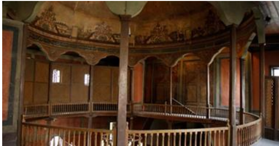
(صورة 6) : الطابق الثانى للتكية ويضم البناوير المخصصة للمشاهدين

وعمارة التكية عبارة عن قاعة مربعة تعلوها قبة مركزية كبيرة، وبها أربعة أضرحة (توابيت)، أكبرها بالقرب من المحراب، ويزينها طراز من النقوش الكتابية، يشمل اسم مشيدها الأمير شمس الدين سنقر السعدى ، ومسرح السمع خانة الدائرى الخشبى معد ليتلائم مع الرقص الدائرى للمولوية ، وتستند القبة إلى الاعمدة الخشبية الاثنا عشر ، ويشغل الطابق الثانى من السمع خانة البناوير وهى الاماكن المخصصة للمشاهدين وهى من الخشب أيضا ويفصل بين أماكن السيدات والرجال فواصل خشبية (صورة 6) .