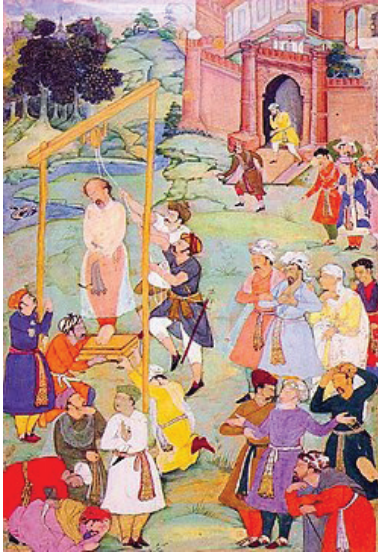
رسم تخيلي لمقتل الحلاج

بباريس بعنوان (عذاب الحلاج) في أكثر من ألف صفحة، وقد اطلعنا عليها وقمنا بتصويرها أثناء تواجدنا بباريس بالجامعة .